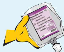
Sistem de dozare Divermite