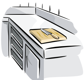
Suprafețe din bucătărie