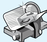
Curăță și dezinfectează într-un singur pas